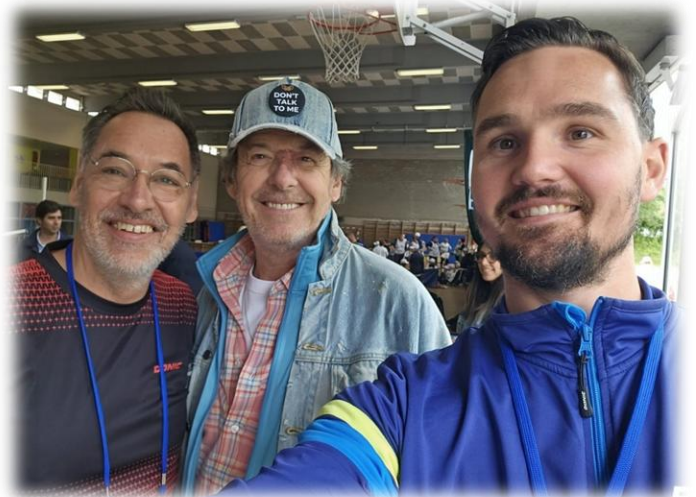
En compagnie de Jean-Luc REICHMANN, Parrain de l'Association « La Chance aux Enfants » Comédien et Animateur du jeu « Les 12 coups de midi »