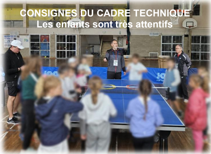
CONSIGNES DU CADRE TECHNIQUE Les enfants sont très attentifs