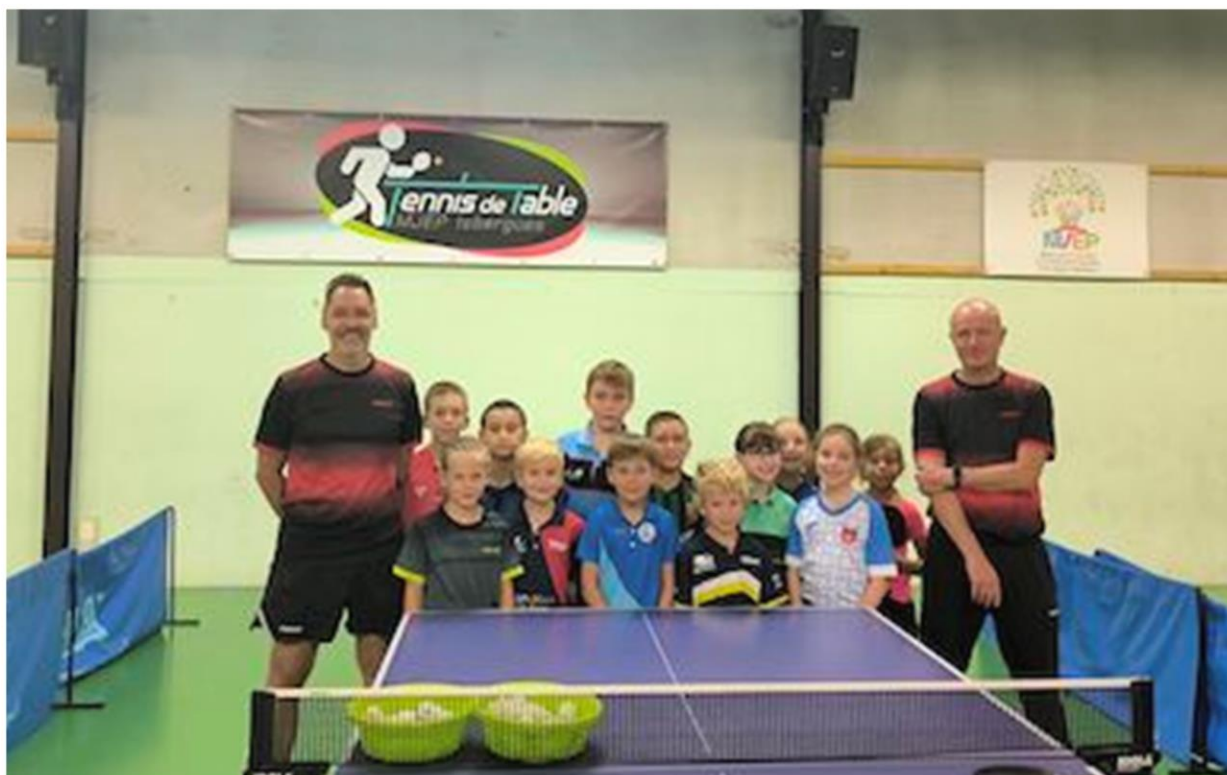
STAGE DÉPARTEMENTAL AOÛT 2024 . JOURNÉE COMMUNE À ISBERGUES