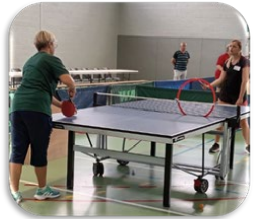
L'ENTRAÎNEMENT DIRIGÉ, LES PARTICIPANTES