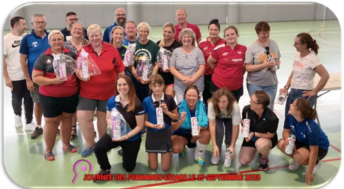
JOURNÉE DES FÉMININES-ESSAIS LE 17 SEPTEMBRE 2023